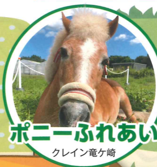
ポニーふれあい クレイン竜ヶ崎